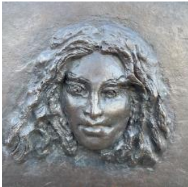
Foto: Hexenverbrennungsdenkmal auf der mittleren Brücke, Basel

Ein Lied, das als Experiment entstand, um zeitgenössische Elemente mit Elementen aus der Popmusik zu kombinieren. Ursprünglich nur mit Ableton live produziert, stand ich vor der schwierigen Aufgabe, den "Song" für ein Ensemble zu arrangieren. Das Ziel war es, so viele verschiedene Texturen und Klangfarben wie möglich zu haben und Instrumente und Techniken zu verwenden, die in der Popmusik selten vorkommen.